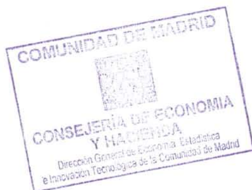
Tabla Input-Output y Contabilidad Regional de la Comunidad de Madrid 1996.