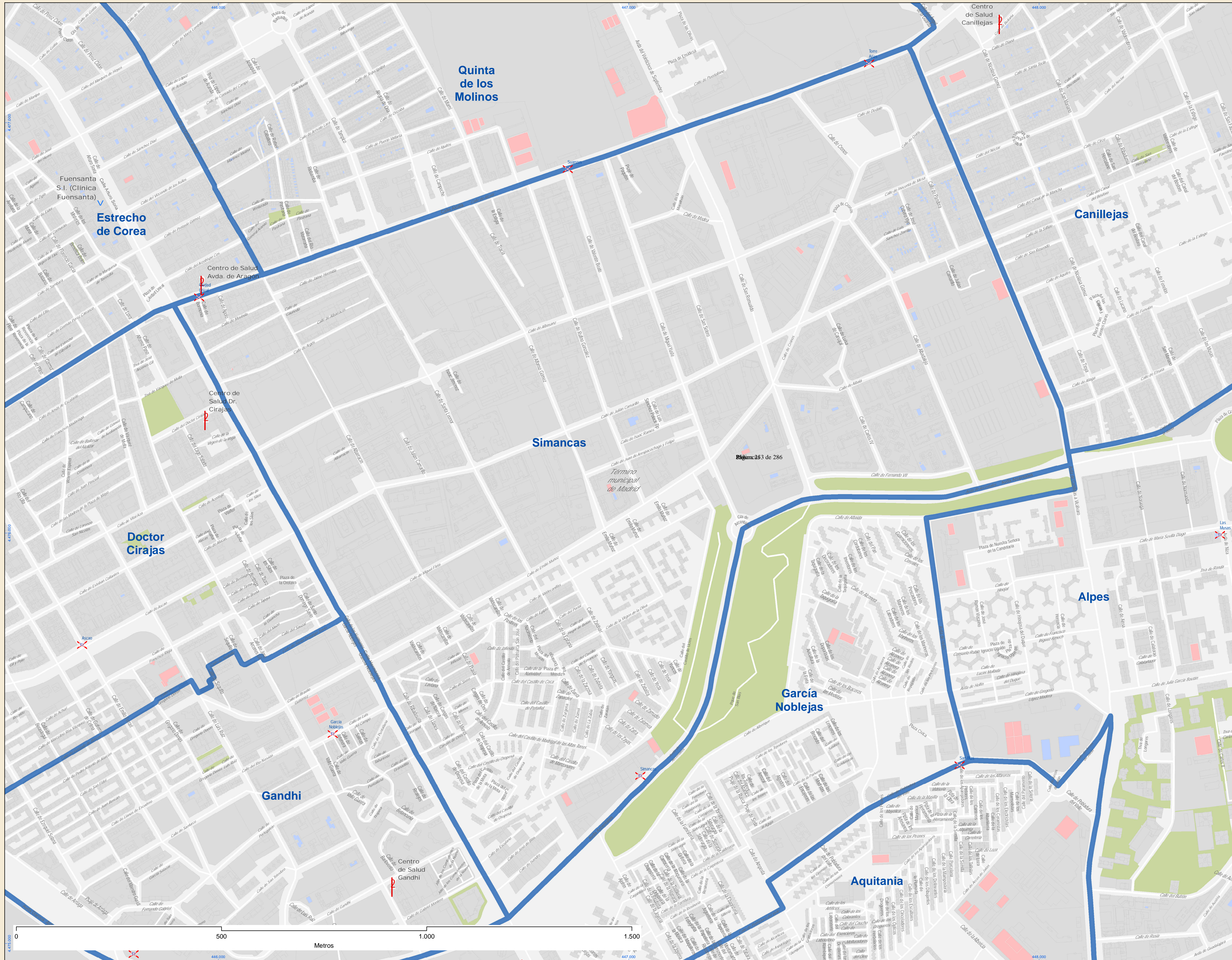
Localización en la Comunidad de Madrid